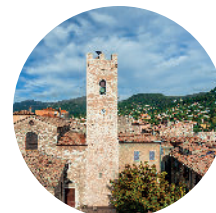
Musée de Vence