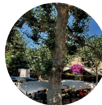
Place du Grand Jardin